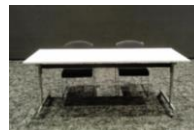
出展協賛A イメージ