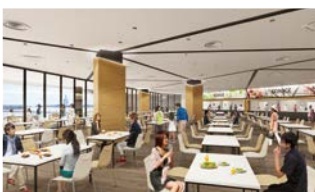
レストラン 300席のフードコートで食を通じて 名古屋の魅力を発信