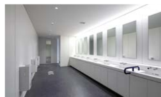
ストレスなく使えるトイレ 男女比変化の対応や一方通行化で 混雑回避