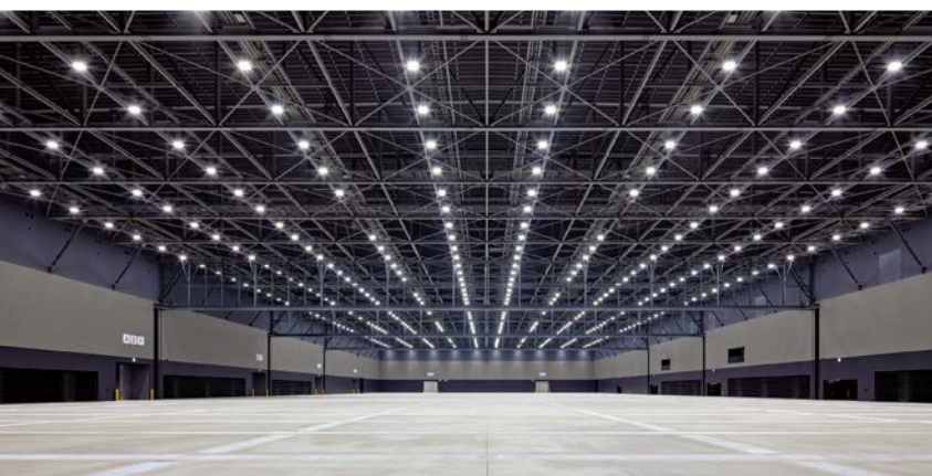
展示ホール 天井高20mで多彩な演出機材も吊り下げ可能