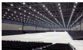
可動階段席 壁面収納の座席でアリーナ会場に 変身