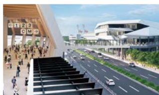
展示館同士を結ぶ「にぎわいデッキ」