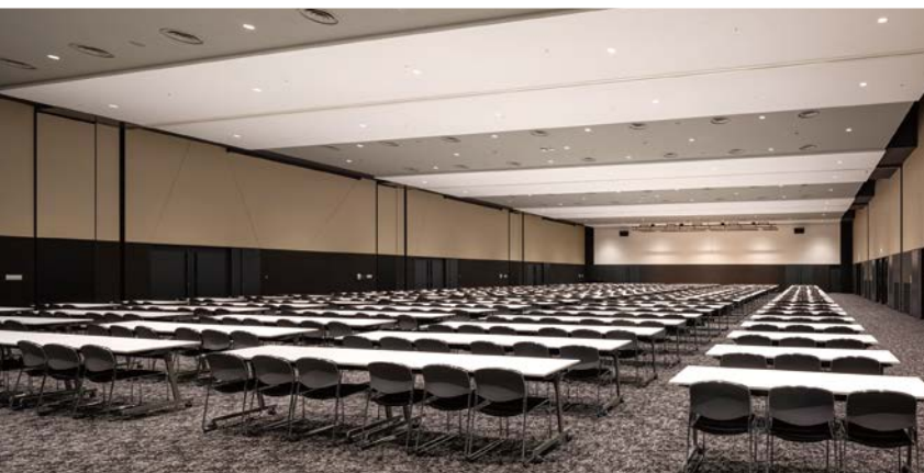
ホールA 最大900人収容可能な大規模会議施設