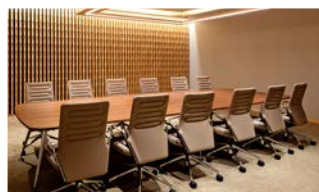
特別室 格調高いVIP室を3室用意