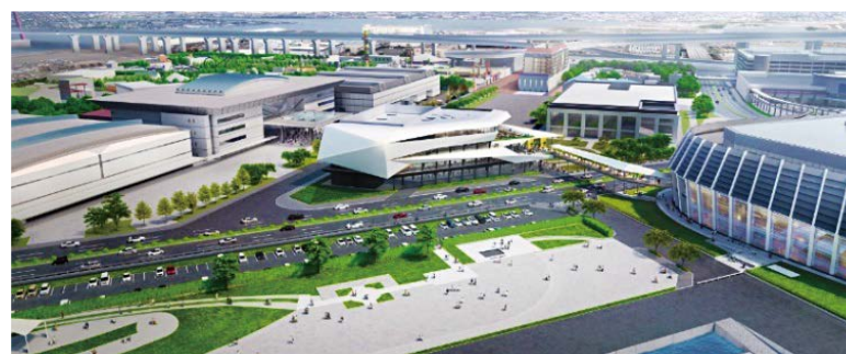
施設全体での一体利用を円滑にする配置