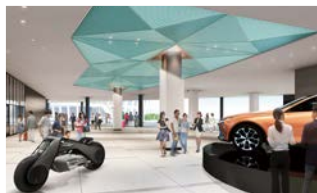
イベントスペース 半屋外空間で展示・イベントが可能