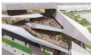
つながるテラス 高さにより変化する景観を楽しむ ことのできる眺望デッキ