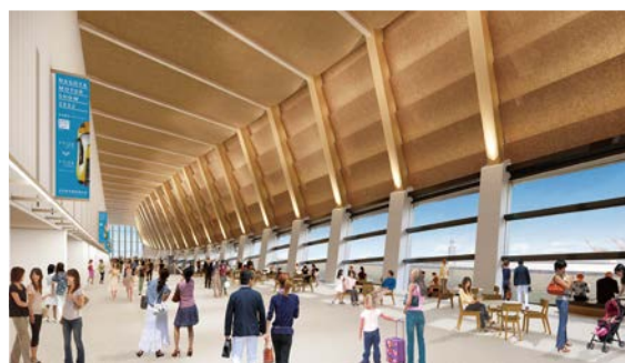
エントランス 温かみのある木質空間でお客様をお出迎え