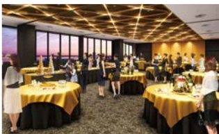
ホールB 海への眺望を楽しみながら パーティも可能